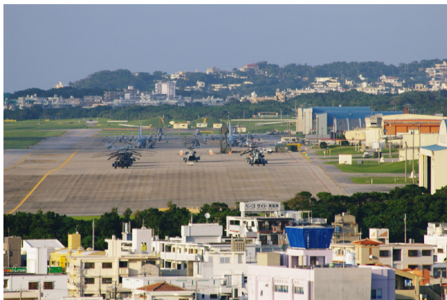
宜野湾市の中心部を占める米海兵隊・普天間基地。滑走路のすぐそばまで、住宅地が接近しています。

基地のヘリコプターは、市街地上空での旋回訓練を1日に150回から300回行います。ひどい時には民家の上空を、30秒おきにヘリコプターが通過するのです。日米政府は1996年に騒音防止協定を結び、住宅密集地・学校・病院の上空での飛行禁止、夜10時から朝6時までの飛行禁止を定めました。しかし、米軍は約束を守りません。