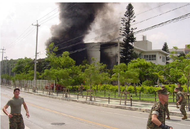
ヘリコプターが墜落した沖縄国際大学。炎上するヘリの黒煙が、周囲を覆いました。