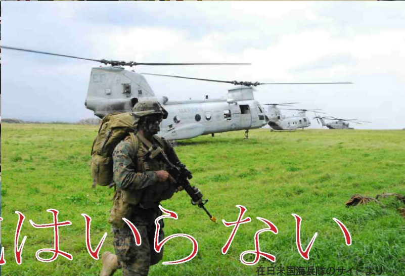
在日米国海兵隊のサイドより