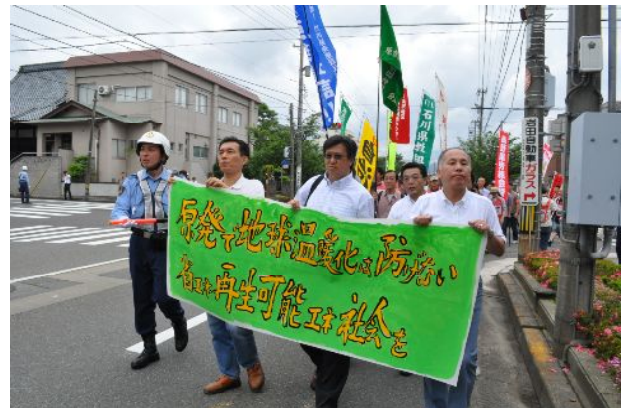
市内をデモ行進（6月19日・福井市）