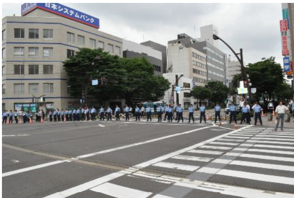
厳戒態勢下の福井市内（6月19日）