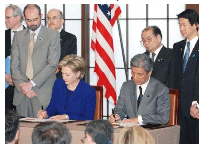
署名するクリントン国務長官

09年2月16日、ヒラリー・クリントン米国務長官がオバマ政権の閣僚として初めて来日しました。短い滞日時間の中でクリントン国務長官は、拉致被害者家族会メンバーとの面会や首相・民主党代表との会談などのハードスケジュールを精力的にこなしましたが、この一連の日程の中で一番重要なのが、「在沖縄海兵隊のグアム移転に係る協定」に署名したことです。中曽根外相とともに署名したこの協定は、正式には「第三海兵機動展開部隊の要員及びその家族の沖縄からグアムへの移転の実施に関する日本国政府とアメリカ合衆国政府との間の協定」と言い、その名称が示すように、在日米軍の再編に伴う米海兵隊のグアム移転について取り決めたものです。